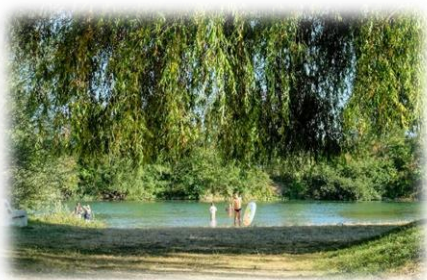
Une des principales causes de contamination est la baignade