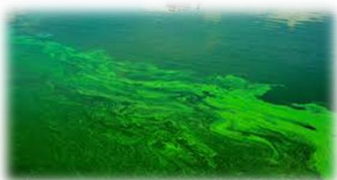
Attention également à la présence de cyanobactéries en période estivale.