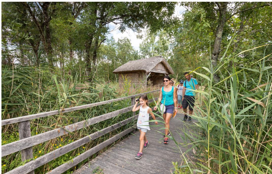
Réserve biologique départementale, Nalliers, Vendée