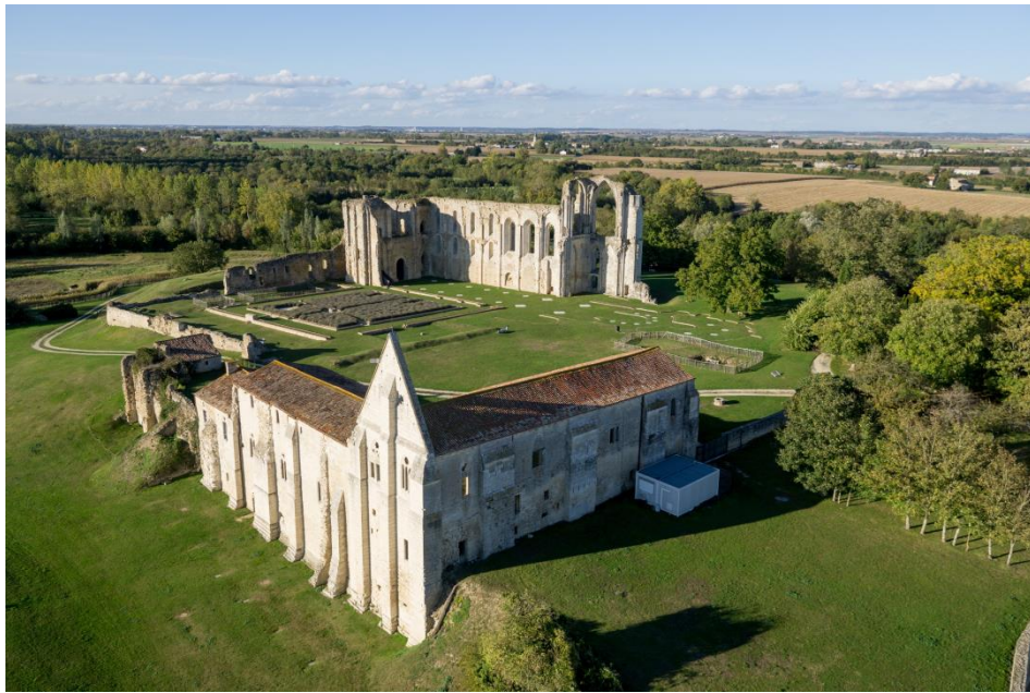
L'Abbaye de Maillezais, Vendée