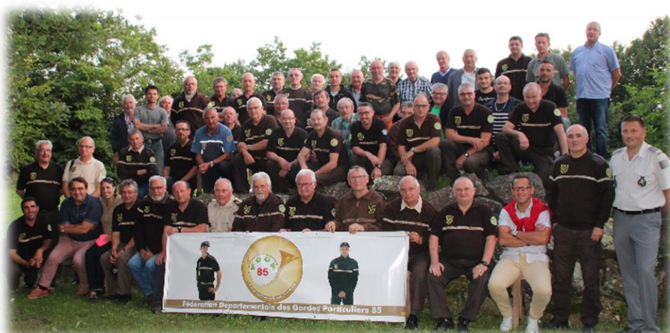
Notre Assemblée Générale 2018

Nous vous souhaitons à tous un agréable séjour en Vendée et un très bon congrès.