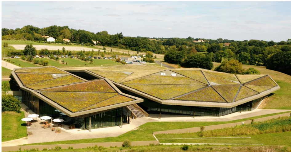
L'Historial, Les Lucs sur Boulogne, Vendée