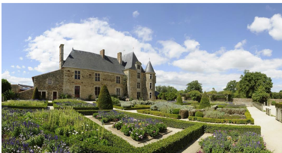
Le logis de la Chabotterie, Vendée